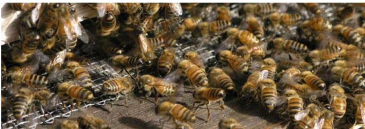
Bierne i flyvespalten ventilerer duftstoffer ud for at markere, hvor de bor

Der kan således ikke være diskussion om, at bifamilien har et ventilationsbehov, også om vinteren. Derimod kan biavlere sikkert diskutere, hvad det bedste er, mange generationer fremover. I mellemtiden overlever bierne de største ekstremer som f.eks. glasrude og plasticdække af tavlerne i trugstader eller opstablingstader med trådbund og ventilationsspalter i topdækket, samt andre mere eller mindre morsomme påhit. Heldigvis. Redaktionen har samlet et par eksempler, som kan læses andetsteds i bladet. Her til højre er princippet i ventilationen vist. Når bierne er i ro, kommer luften ind, og når de bevæger vingerne, bliver luften sendt ud af stedet.