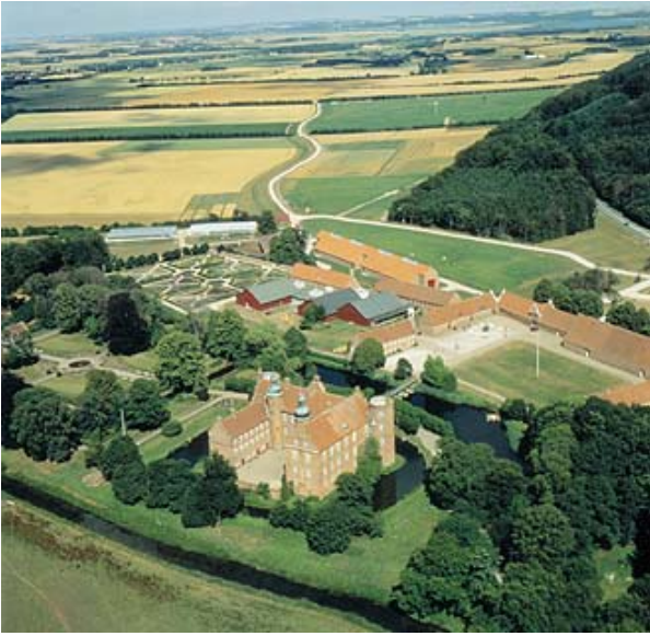
Herregård og landbrugsmuseum Gl.Estrup