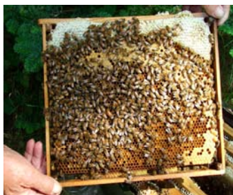
Yngellejet på de gamle tavler i nederste kasse

2. Om foråret giver man stedet en slags "kolbøtte"