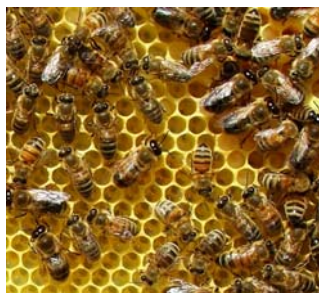
Om foråret er yngellejet oppe i den øverste kasse

2. Om foråret giver man stedet en slags "kolbøtte"