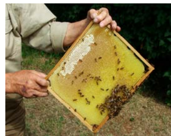
De nye tavler bliver hurtigt udbygget og fyldt med honning

3. Allerede nu er stedet forberedt til næste indvintring